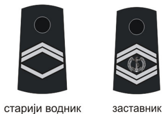
Слика 3 - Навлаке са означеним чиновима подофицира КоВ, РВ и ПВО и рода РЈ (Напомена: Навлаке се испоручују без металних елеманата ознака чина заставника)

Чинови официра КоВ и РВиПВО означавају се металним розетама златне боје и ширитима од срме златне боје са црним ивицама, и то: