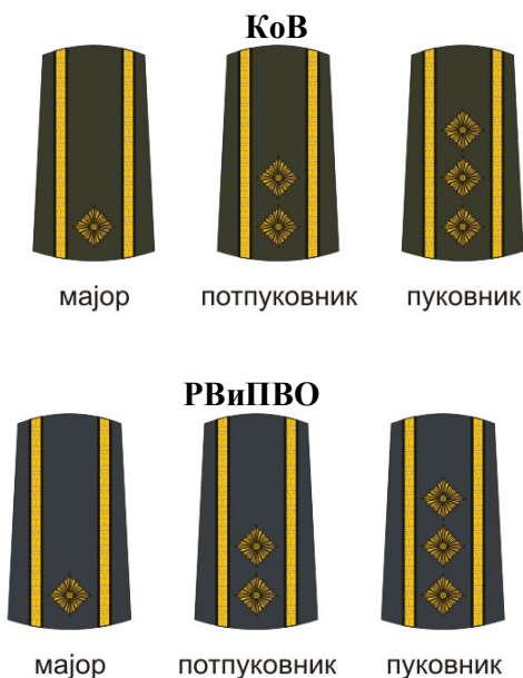
Слика 4 - Навлаке са означеним чиновима официра КоВ и РВиПВО (све навлаке се испоручују без розета)

Изглед навлака са означеним чиновима официра КоВ и РВ и ПВО приказан је на слици 4.