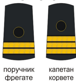
Слика 5 – Изглед навлака са означеним чиновима официра рода РЈ

Изглед навлака са означеним чиновима официра рода РЈ приказан је на слици 5.