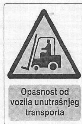
ред. бр. 6