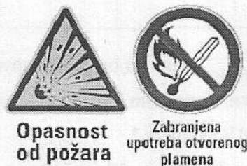
ред. бр. 3