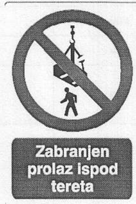
ред. бр. 5