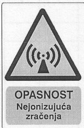
ред. бр. 4